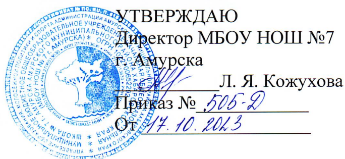
График заседаний Штаба воспитательной работы МБОУ НОШ №7 г. Амурска на 2023–2024 учебный год